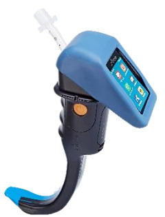
[付属・シリコンカバー]