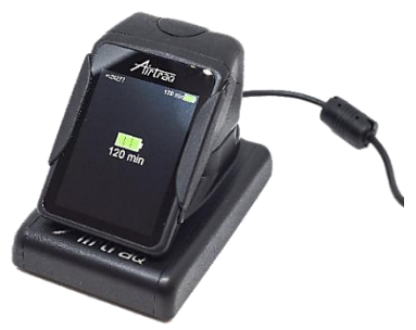
[付属・ドッグステーション]