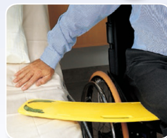
座位 移乗ボード グライドボード