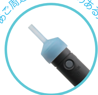
別売 口腔チューブ

本品で話すためには練習が必要です。(習熟には個人差があります) 口と舌で言葉をつくる必要があります。 言葉によって発声しにくい場合があります。