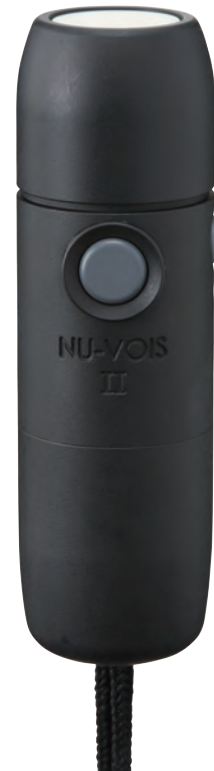
写真はニューボイスⅡ