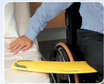
座位 移乗ボード ガイドボード