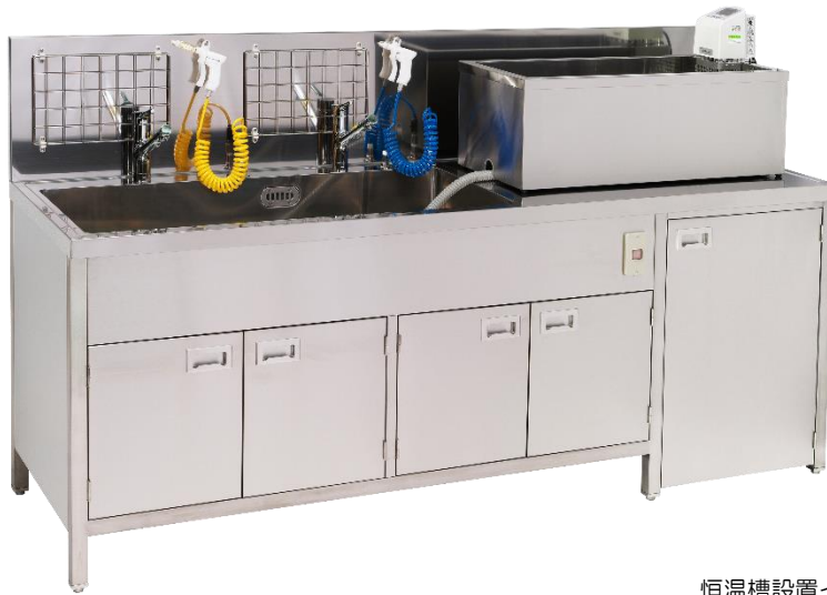
恒温槽設置イメージ